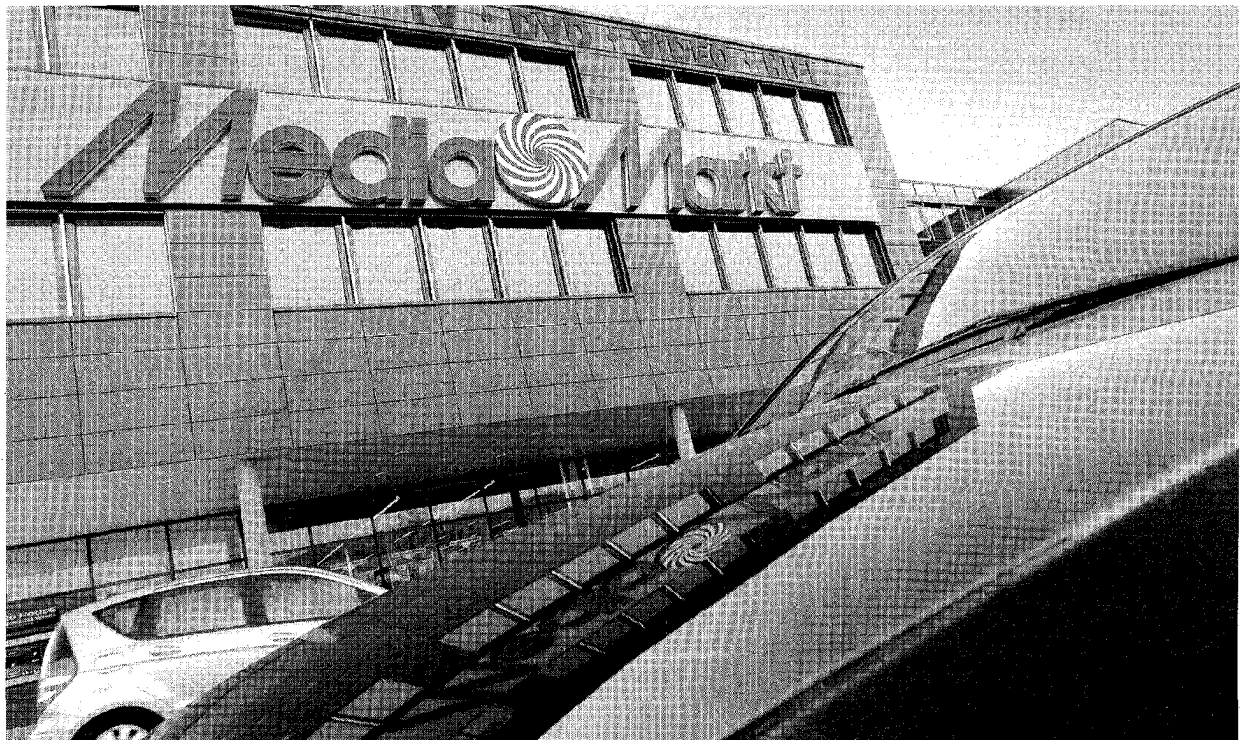
Weil Media Markt Muri – wie andere Händler auch – das Computerspiel «Stranglehold» verkauft, kommts zum Prozess. ADRIAN MOSER