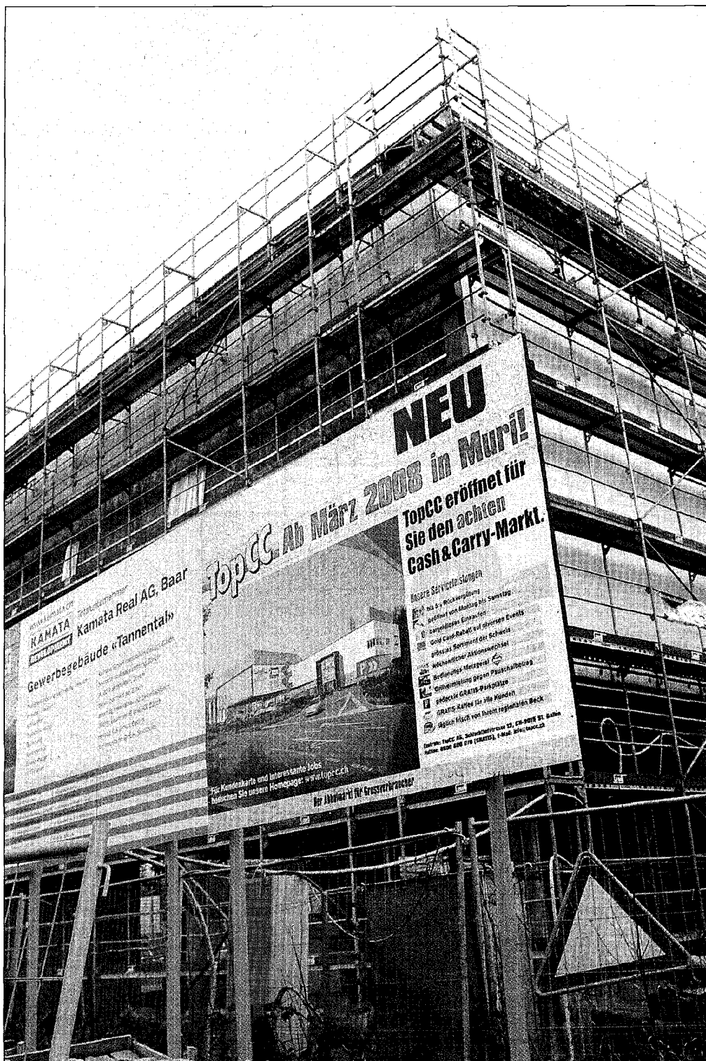
Dürfen sie einziehen oder nicht? Am 26. März will TopCC im Areal Tannental starten, bereits Anfang März möchten Qualipet und Jysk eröffnen. Nun sind diese Termine unsicher.